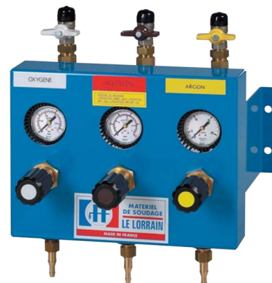
Housing dimensions (in mm)